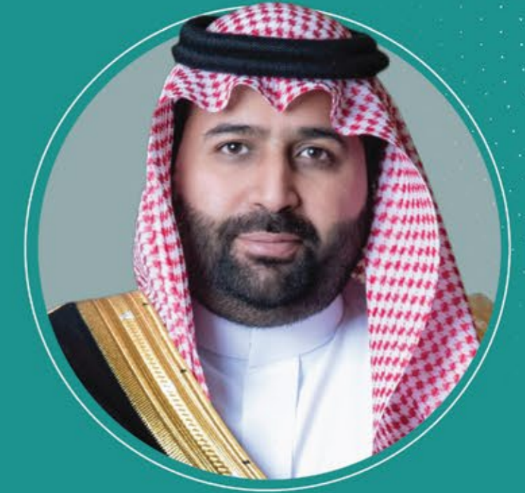
صاحب السمو الملكي الأثير محمد بن عبد الله بن محمد بن عبد العزيز السعوف أمير منطقة جازان