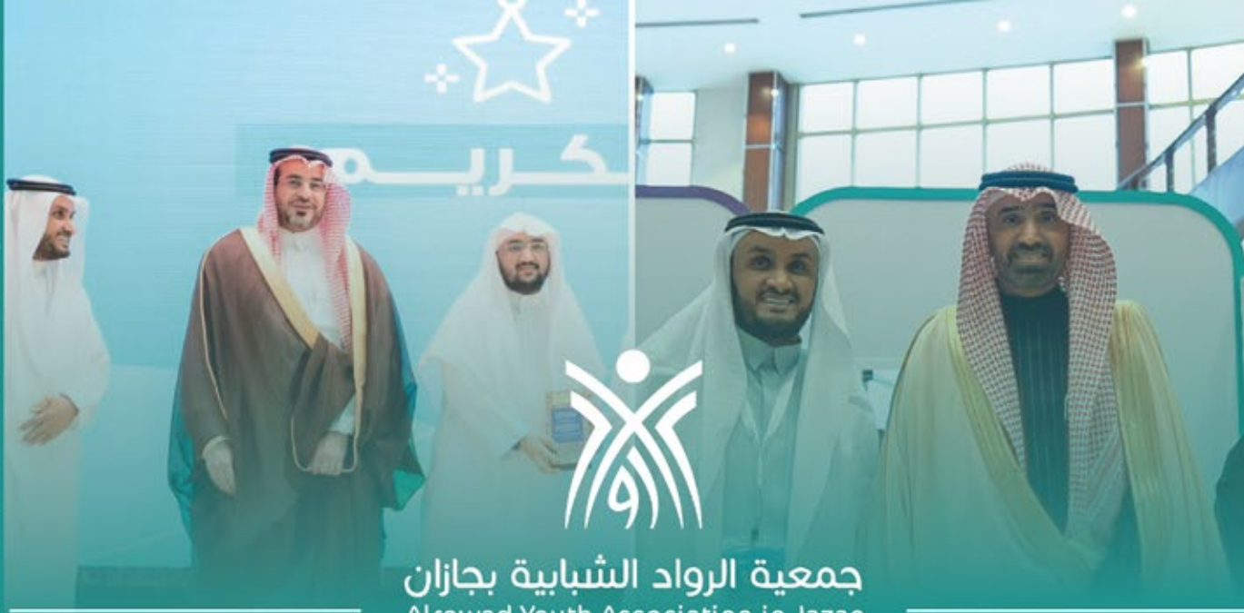
جمعية الرواد الشبابية بجازان Alrowad Youth Association in Jazan