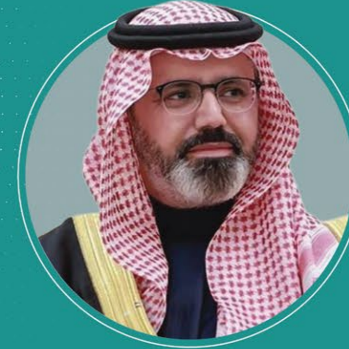
صاحب السمو الأثير ناصر بن محمد بن عبد الله بن جالوي السعوف نائب أمير منطقة جازان